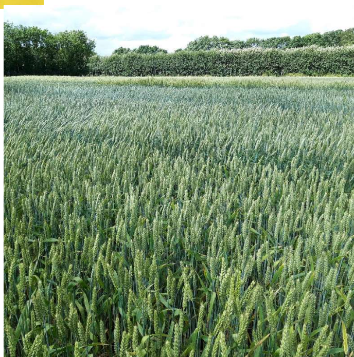
Flot vinterhvede på Jynde vad