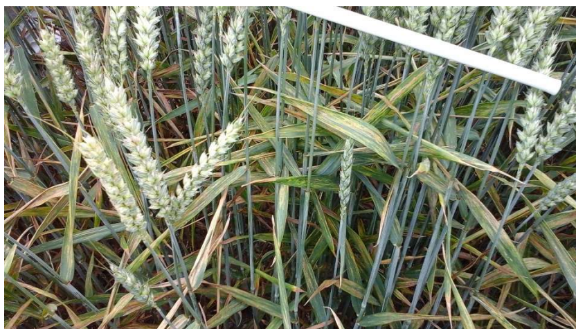
Angreb kun af gulrust 3.7.20

Kraftige angreb af brunrust med sorte teleosporer 3.7.20