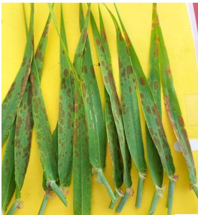
MLO pletter i Alexis