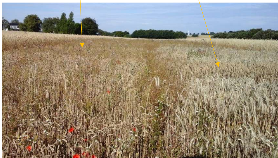
Triticale d. 12.7.20