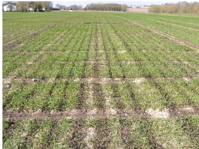
Vinterhvede d. 4.4.20 efter gylle nedlægning

Vinterhvede 1 lidt gulrust i MS-sorterne Vinterbyg 0 Rug 0 Triticale 0